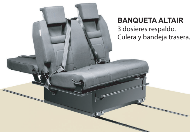
BANQUETA ALTAIR 3 dosieres respaldo. Culera y bandeja trasera.